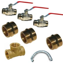
KIT BY-PASS 3/4"