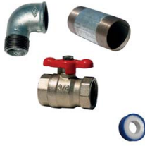
KIT DE PURGE 500 LITRES