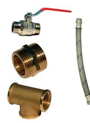
KIT BY-PASS 1"